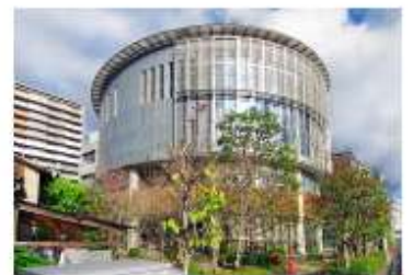
円柱の建物と楠木が目印

「大阪ビジネスパーク」駅①番出口を出て、川沿い（川が右手）を歩く。 突き当たり、弁天橋北詰の信号を渡ったところにある、小さな階段を降りる。 川沿いを歩くと左手に大阪府看護協会（ナーシングアート大阪）が見えてまいります。